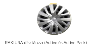
RAKIURA disztárcsa (Active és Active Pack)